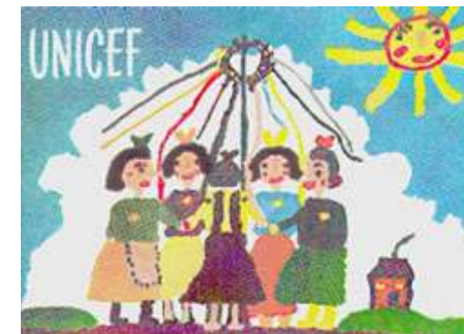
Jitka Samkova rajza - 1949